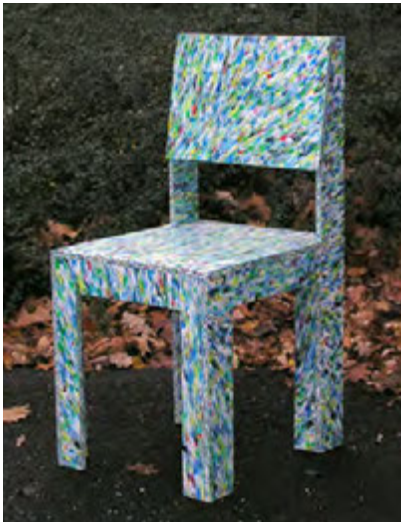
hergestellt aus Metall, Polyethylen HD, 1992

Das Deutsche Kunststoff Museum vermittelt auf der KUTENO den kulturhistorischen Kontext des Kunststoff-Recyclings und präsentiert eine Auswahl an Designikonen aus recycelten Materialien, Produktbeispiele aus biobasierten Materialien und geht dabei zurück bis ins frühe 20. Jahrhundert ins Zeitalter des Bakelits.