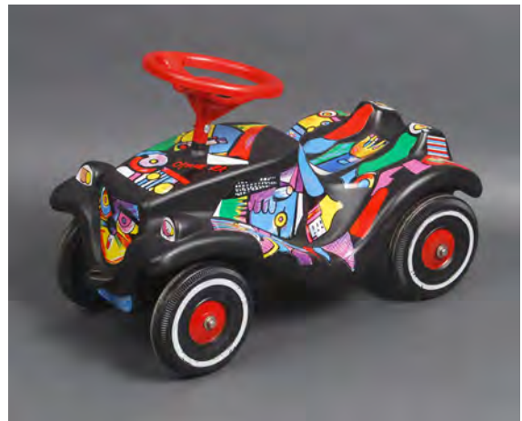
hergestellt aus Recyclat, 1994, Aufkleber: Otmar Alt