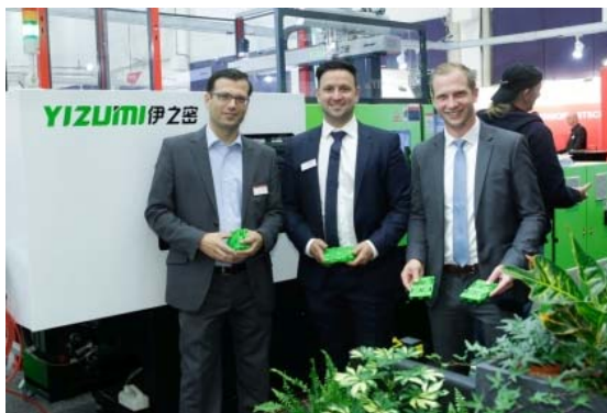
Yizumi Germany GmbH sieht die KUTENO als Messe für die Zukunft.